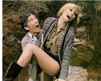
1975 CARRY ON... BEHIND de Gerald Thomas avec Kenneth Williams