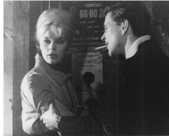
1962 LA FILLE ET LE PROCUREUR (Das Mädchen und der Staatsanwalt) de Jürgen Goslar avec Götz George