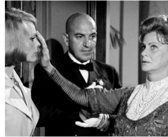
1973 LA MAISON DE L'EXORCISME (La Casa dell'esorcismo) de M. Bava avec T. Savalas, A. Valli