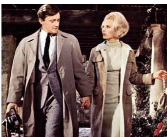
1967 MINUIT SUR LE GRAND CANAL (The Venetian Affair) de Jerry Thorpe avec Robert Vaughn