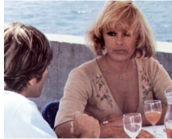
1976 TROUVE LES ET TUE LES (Pronto ad uccidere) de Francesco Prosperi avec Ray Lovelock