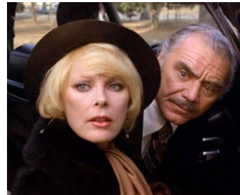
1979 THE DOUBLE MCGUFFIN de Joe Camp avec Ernest Borgnine