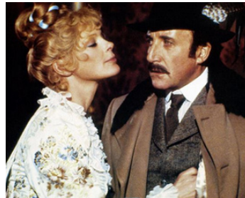
1979 LE PRISONNIER DE ZENDA (The Prisoner of Zenda) de Richard Quine avec Peter Sellers