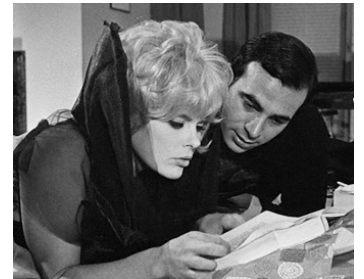
1965 LES POUPÉES (Le Bambole) de Luigi Comencini avec Maurizio Arena