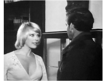
1979 THE TREASURE SEEKERS d'Henry Levin avec Rod Taylor