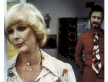
1976 ONE AWAY (One Away) de Sidney Hayers avec Bradford Dillman