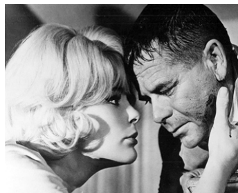
1965 PIÈGE AU GRISBI (The Money Trap) de Burt Kennedy avec Glenn Ford