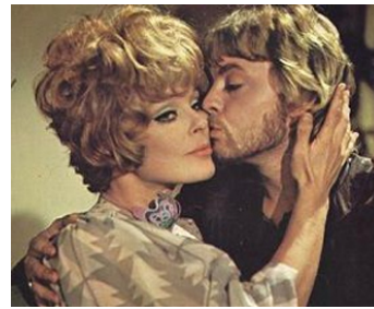
1971 MON PETIT OISEAU S'APPELLE PERCY (Percy) de Ralph Thomas avec Hywell Bennett