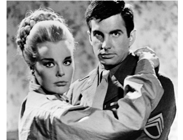
1963 LES VAINQUEURS (The Victors) de Carl Foreman avec George Hamilton