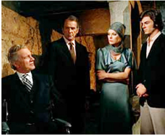
1972 BARON VAMPIRE (Gli Orrori del castello...) de Mario Bava avec Joseph Cotten, M. Girotti