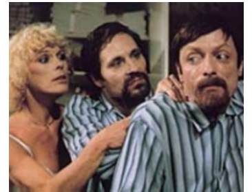
1981 L'HOMME EN PYJAMA (Der Mann im Pyjama) de Ch. Rateuke avec Otto Sander