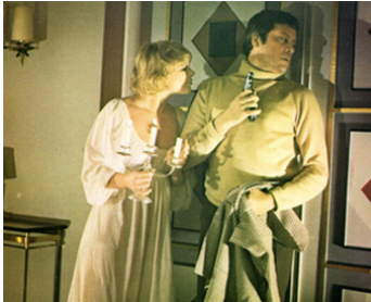
1974 DIX PETITS NÈGRES (And then there were none) de Peter Collinson avec Oliver Reed