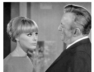
1968 LES HOMMES DE LAS VEGAS (Las Vegas, 500 millones) d'A. Isasi-Isasmendi avec Lee J. Cobb