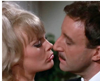
1964 QUAND L'INSPECTEUR S'EMMÊLE (A Shot in the Dark) de B. Edwards avec Peter Sellers