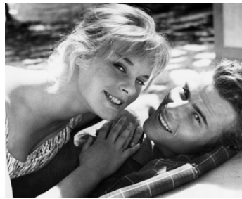
1959 LES MUTINS DU YORIK (Das Totenschiff) de George Tressler avec Horst Buchholz