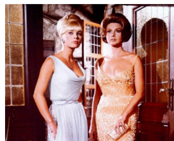
1967 PLUS FÉROCES QUE LES MÂLES (Deadlier than the Male) de Ralph Thomas avec Sylva Koscina