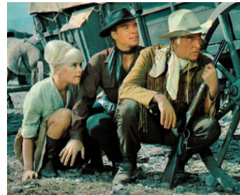
1964 PARMI LES VAUTOURS (Unter Geiern) d'Alfred Vohrer avec G. George, S. Granger