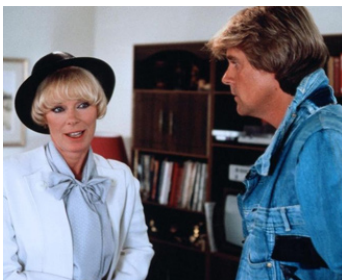
1984 NIEMAND WEINT FÜR IMMER de Jans Rautenbach avec Howard Carpendale