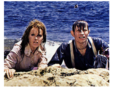
1971 ZEPPELIN (Zeppelin) d'Étienne Périer avec Michael York