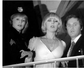
1978 L'ÉTRANGLEUR INVISIBLE (Invisible Strangler) de John Florea avec Robert Foxworth