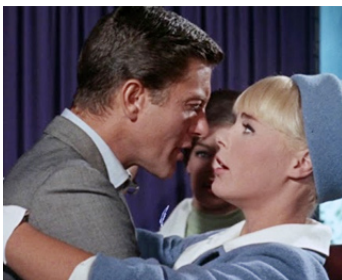
1965 GARE À LA PEINTURE (The Art of Love) de Norman Jewison avec Dick Van Dyke