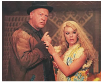
1970 LES HÉROS DE YUCCA (The Invincible Six) de Jean Negulesco avec Curd Jürgens