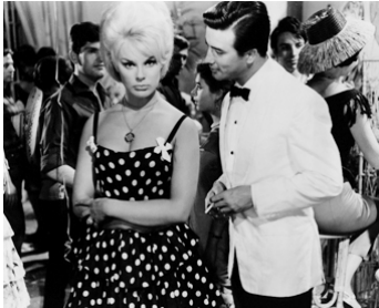
1962 DOUCE VIOLENCE de Max Pécas avec Pierre Brice