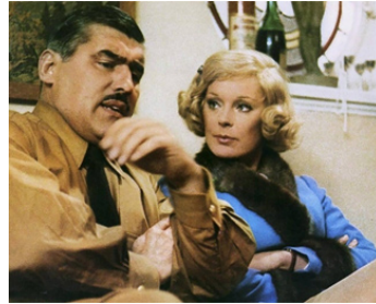
1973 LE VOYAGE POUR VIENNE (Die Reise nach Wien) d'Edgar Reitz avec Mario Adorf