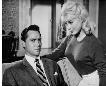
1961 TROUBLEZ-MOI CE SOIR (Don't bother to knock) de Cyril Frankel avec Richard Todd