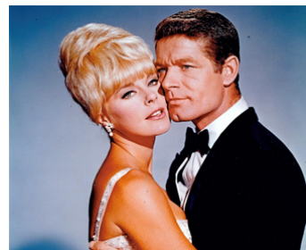
1966 LA STATUE EN OR MASSIF (The Oscar) de Russell Rouse avec Stephen Boyd