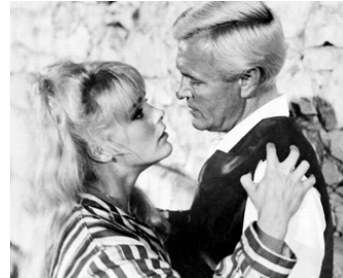
1963 SÉDUCTION EN BORD DE MER (Verführung am Meer) de Jovan Zivanovic avec P. Van Eyck