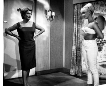
1962 LE TÉLÉPHONE SONNE LA NUIT (Nachts ging das Telefon) de Geza von Cziffra avec I. Andree