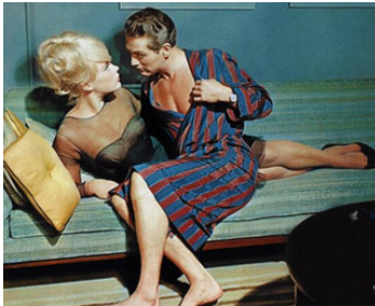
1963 PAS DE LAURIERS POUR LES TUEURS (The Prize) de Mark Robson avec Paul Newman