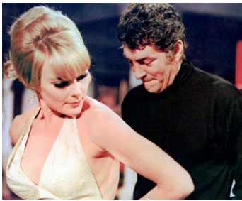
1968 MATT HELM RÈGLE SON COMTE (The Wrecking Crew) de P. Karlson avec Dean Martin