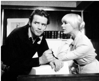
1979 LE CASSE DE BERKELEY SQUARE (A Nightingale sang...) de Ralph Thomas avec Richard Jordan