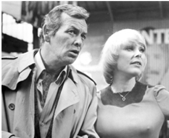
1976 THE SWISS CONSPIRACY de Jack Arnold avec David Janssen