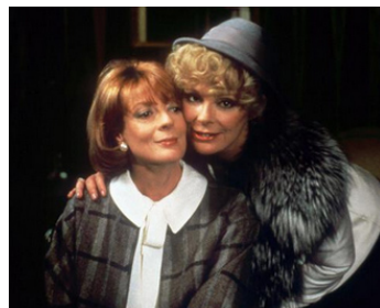
1984 LILY EST AMOUREUSE (Lily in Love) de Karoly Makk avec Maggie Smith